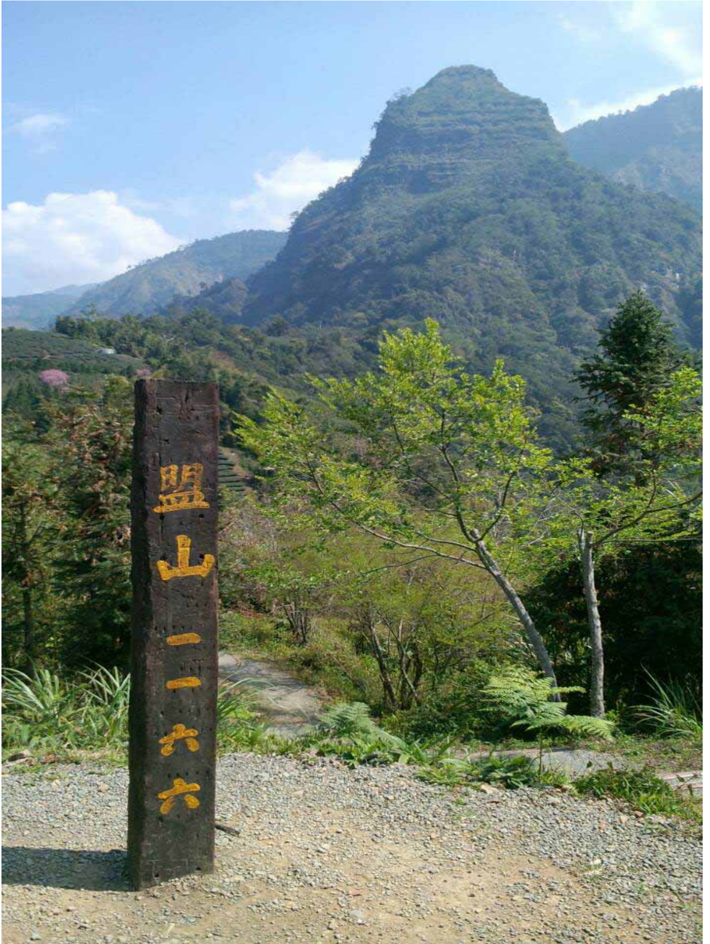
站在最高點盟山 1166，面對鄒族聖山群-小塔山(聖觀音峰)