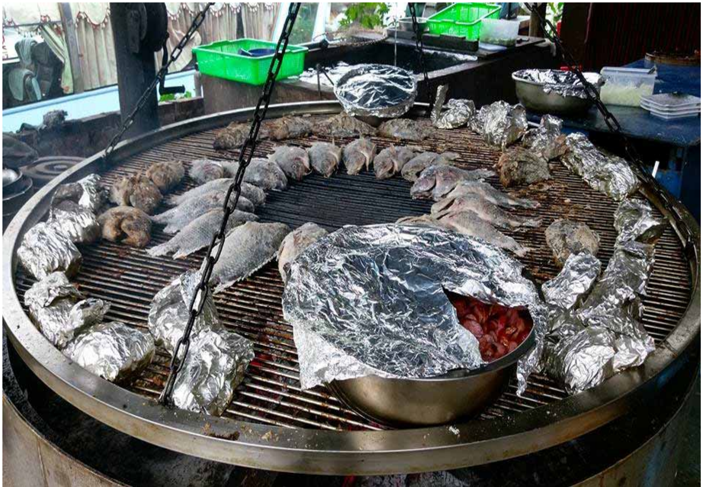
總令人垂涎三尺的原住民風味餐