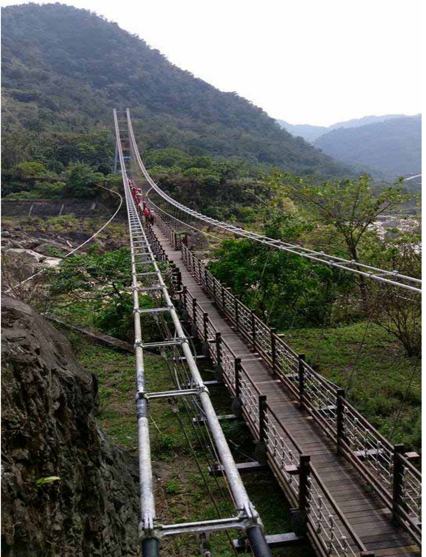
歷經風災重建的達娜伊橋，橋下孕育著俗稱“苦花”的高鯧鯛魚”