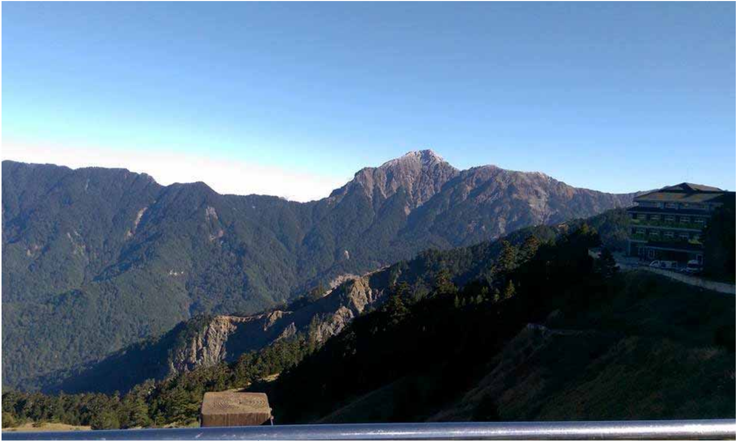
合歡山遠眺黑色奇萊山