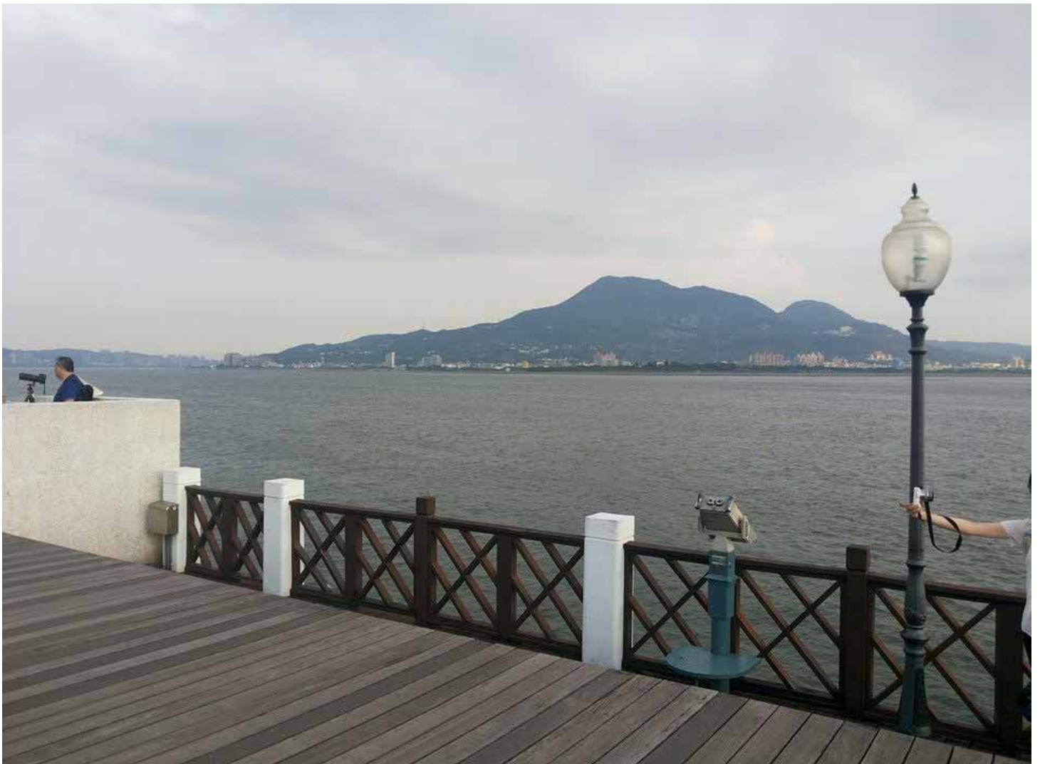
在八里左岸騎單車，除了欣賞淡水河景，鄰近許多景點更是豐富有趣