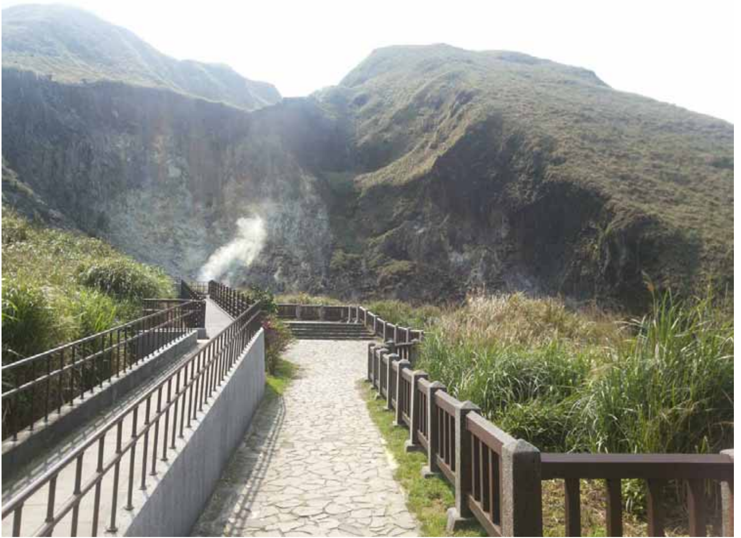
七星山不僅是台北城第一高山，也是建城時風水指標