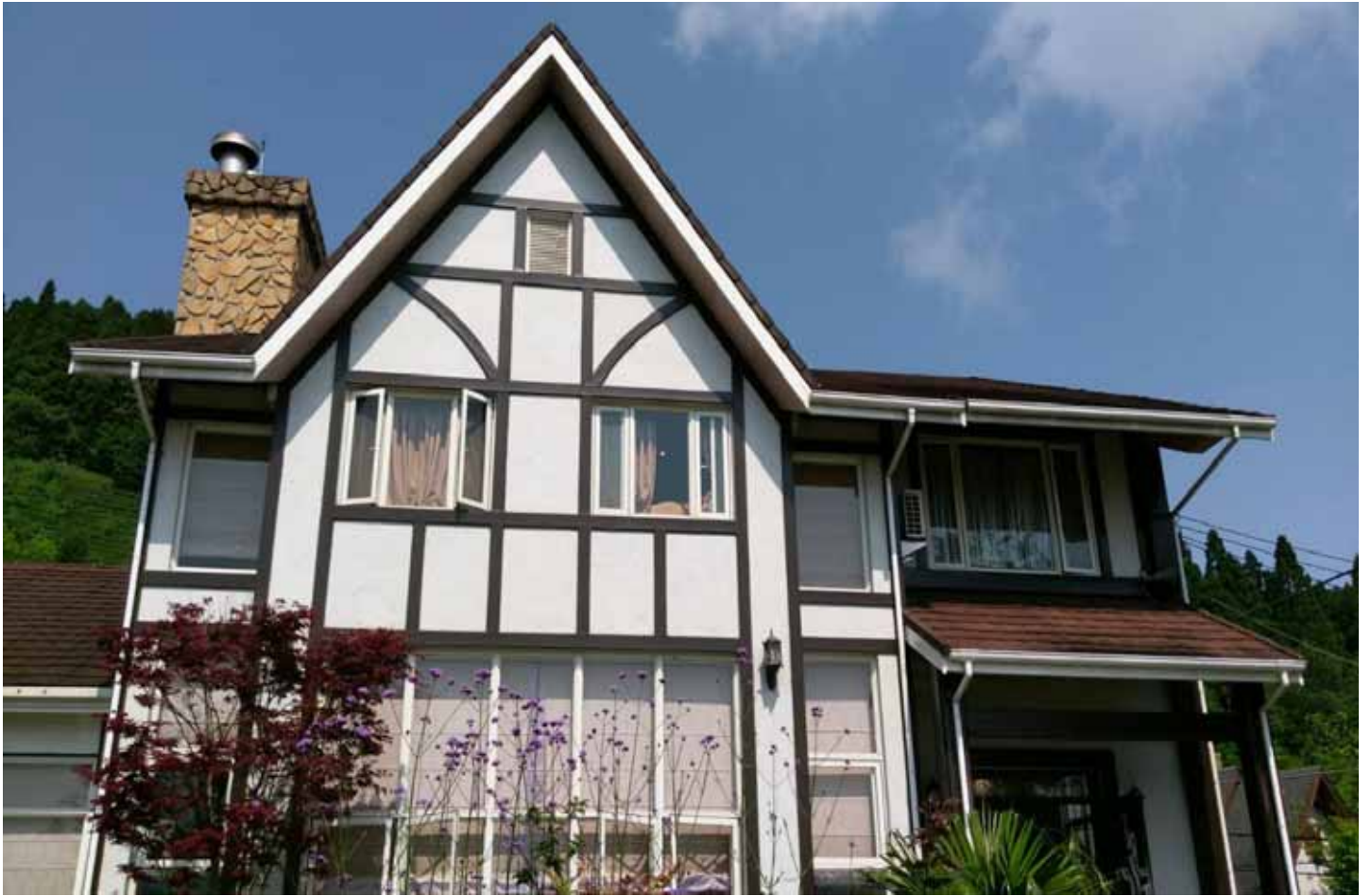
山上人家鄰近五峰鄉鵝公髻山，歐洲都鐸式建築，是渡假放鬆的最佳選擇