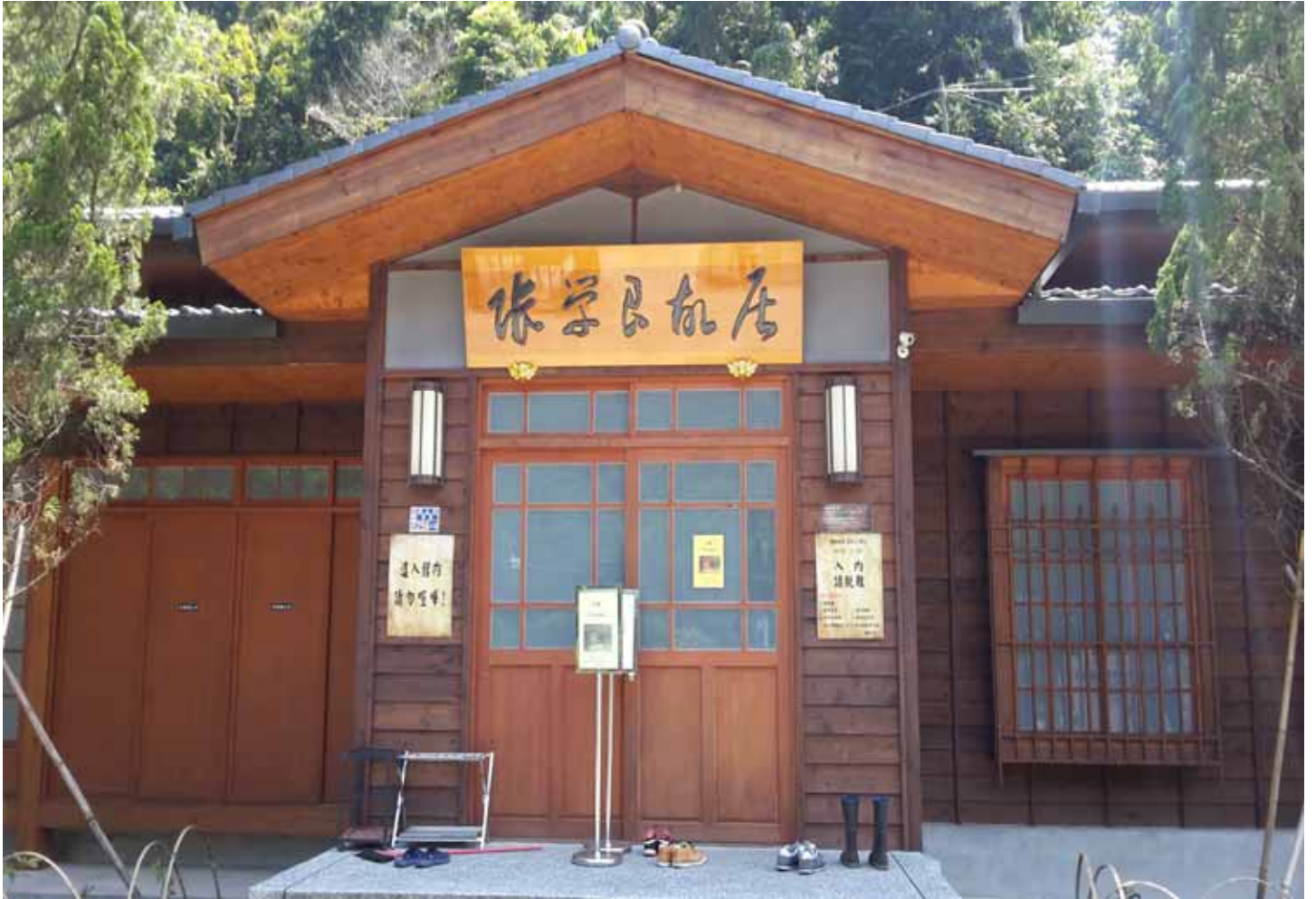
張學良故居：山居幽處境，舊雨引心寒。輾轉眠不得，枕上淚難乾