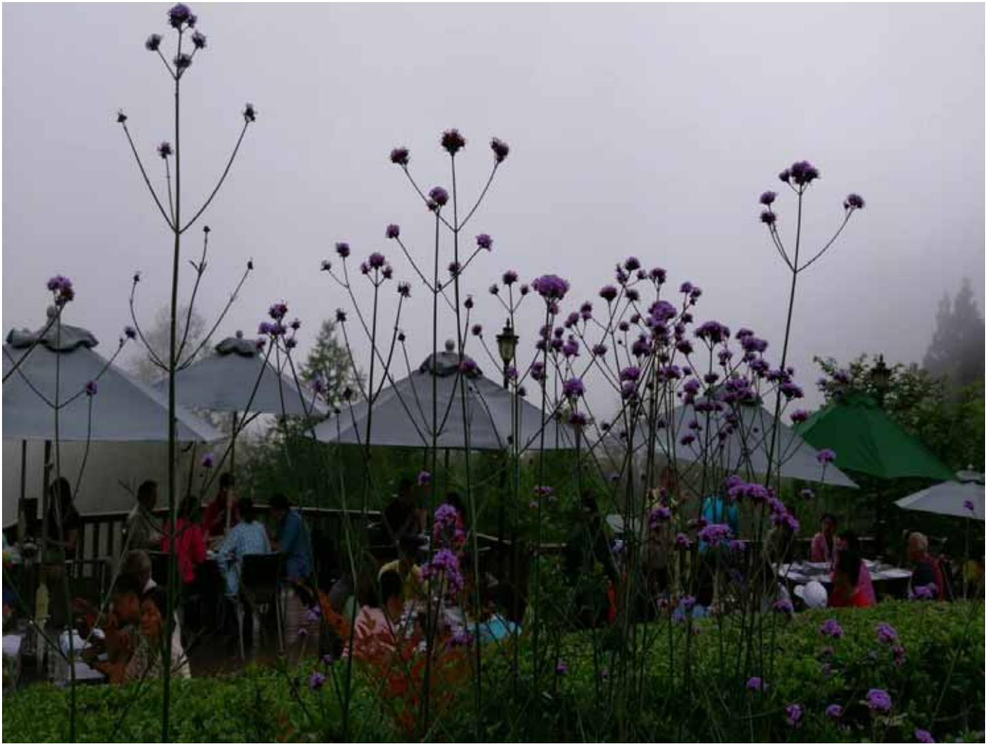
海拔 1200 公尺，山嵐無時飄落，享受宛如仙境的用餐環境