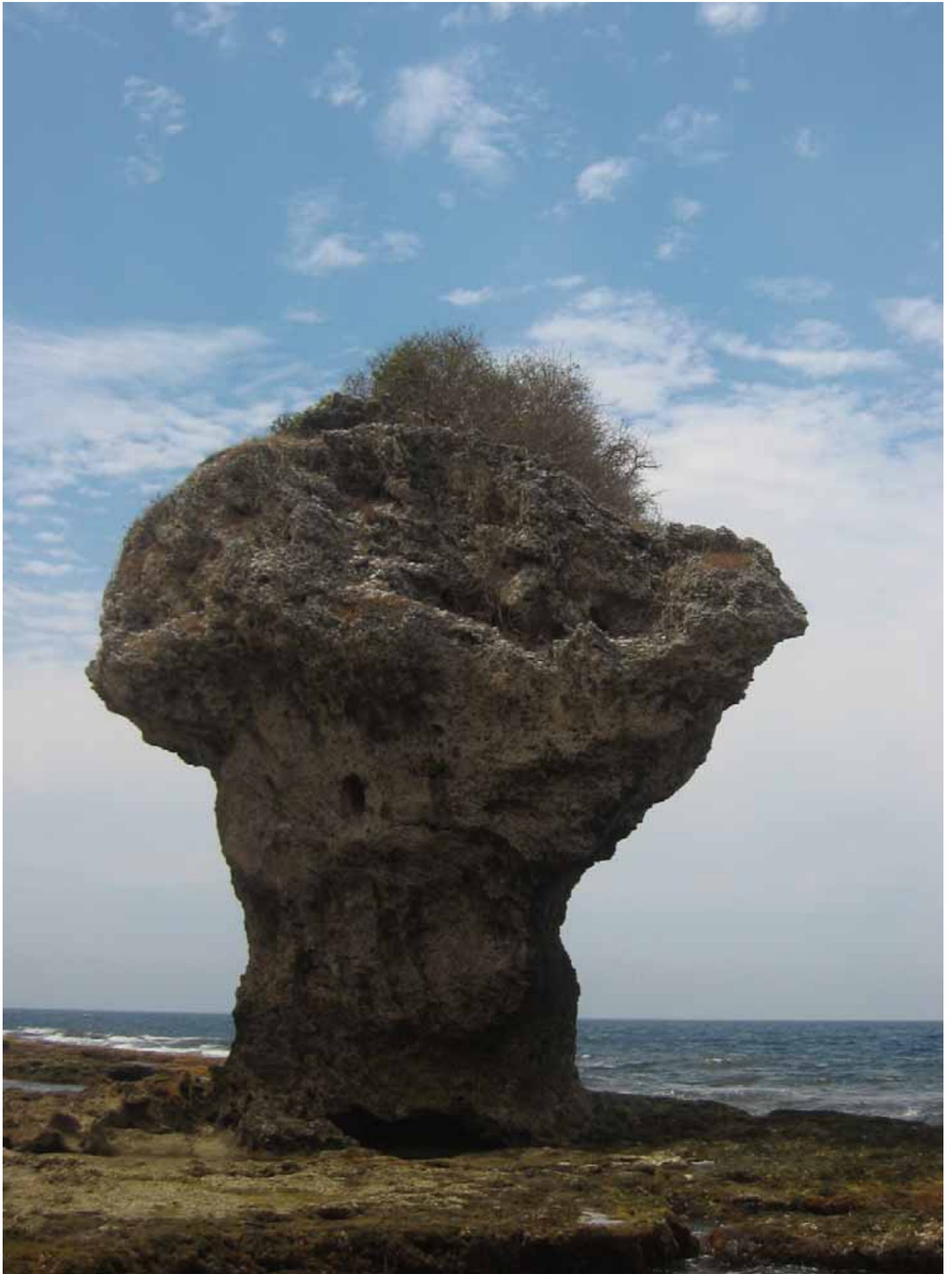
小琉球的地標-花瓶嶼