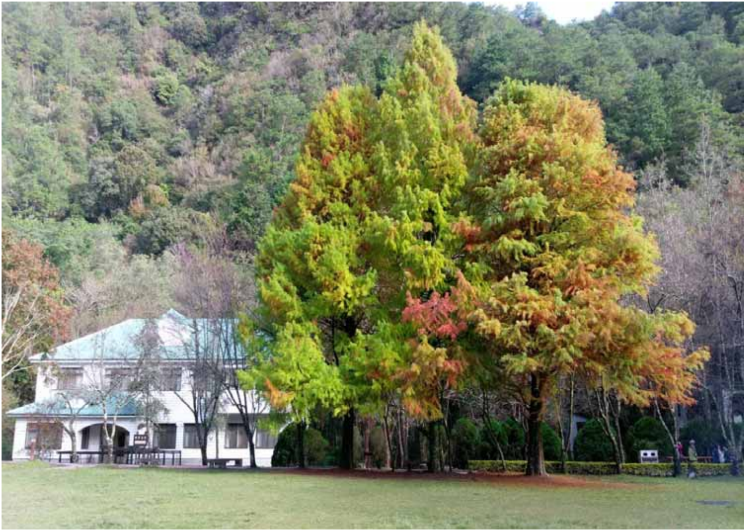
奧萬大的落羽松，在秋風中展現多采風貌