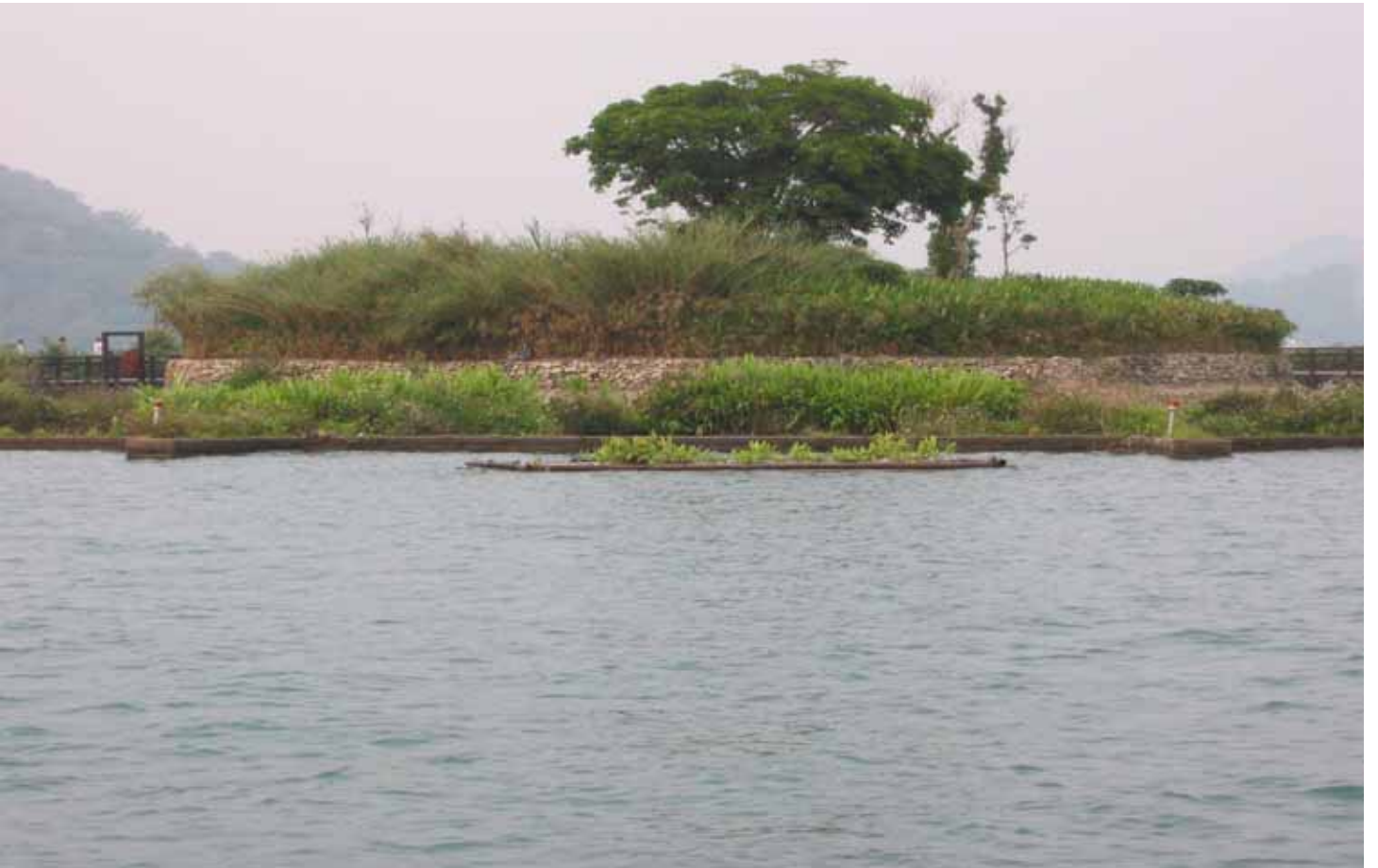
拉魯島是邵族人的祖靈聖地，島上的茄苳樹是祖靈聖樹