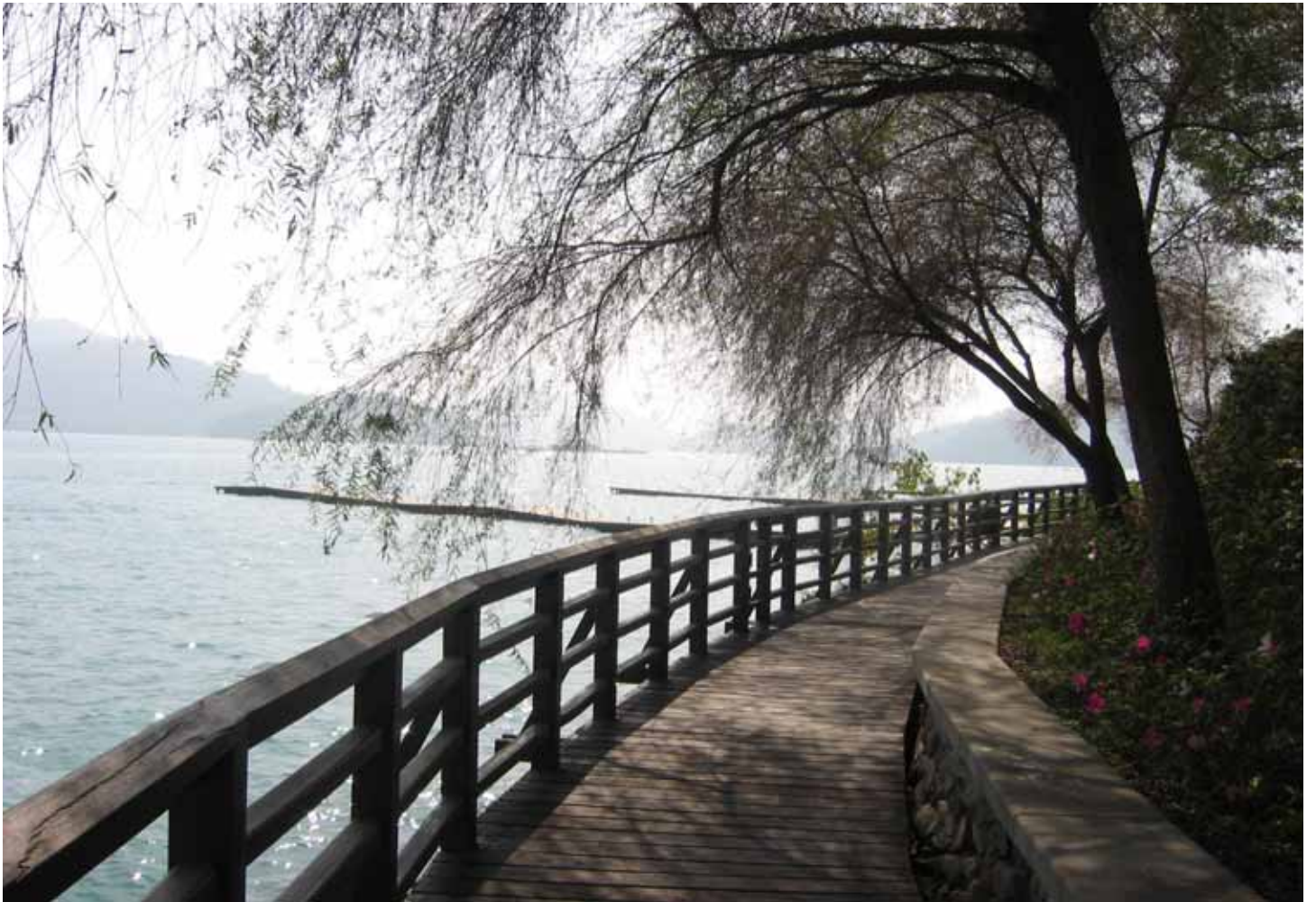
日月潭秀麗的風光，曾入選”全球十大最美自行車道”