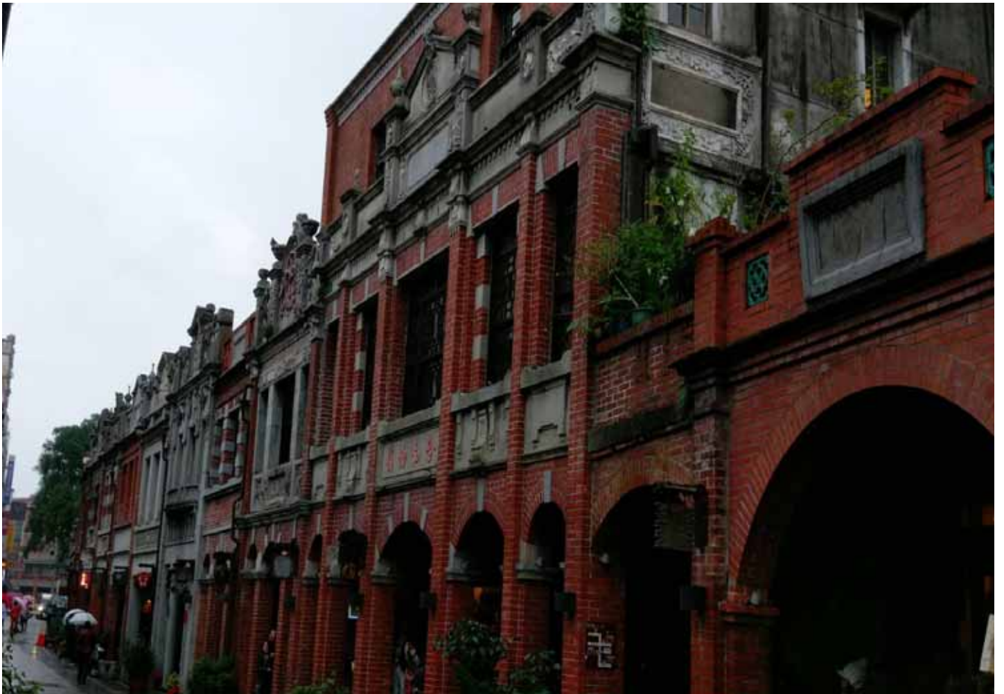
舊名“三角湧”的三峽老街，因河港轉運茶葉、藍染，造就繁華榮景