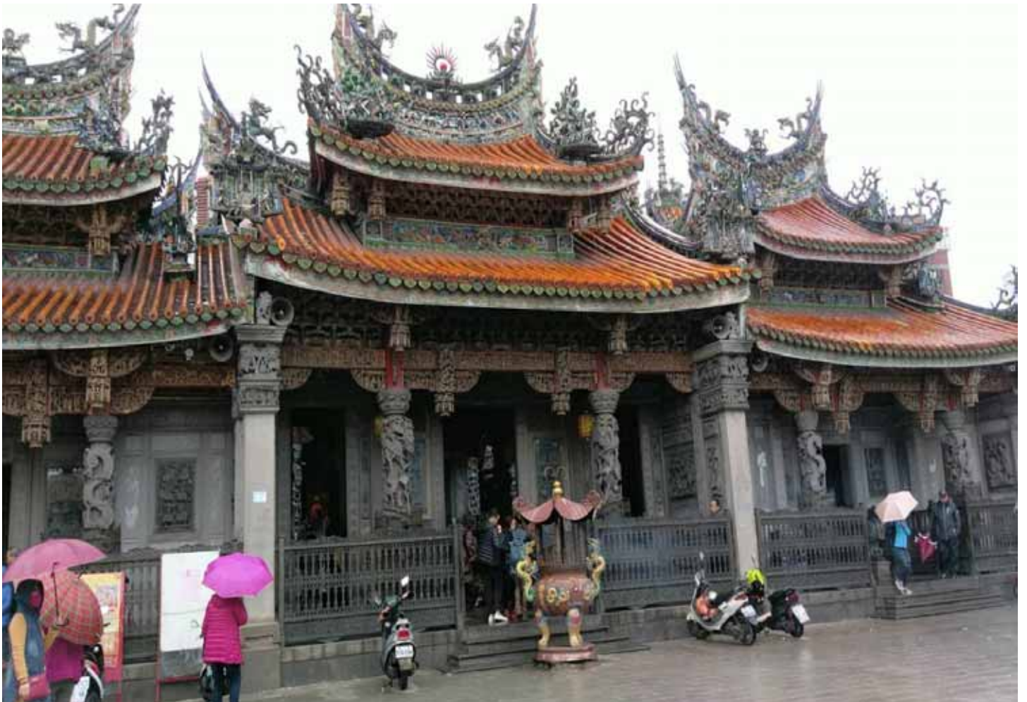
李梅樹大師畢生心血結晶的清水祖師廟，有“東方的藝術殿堂之美譽