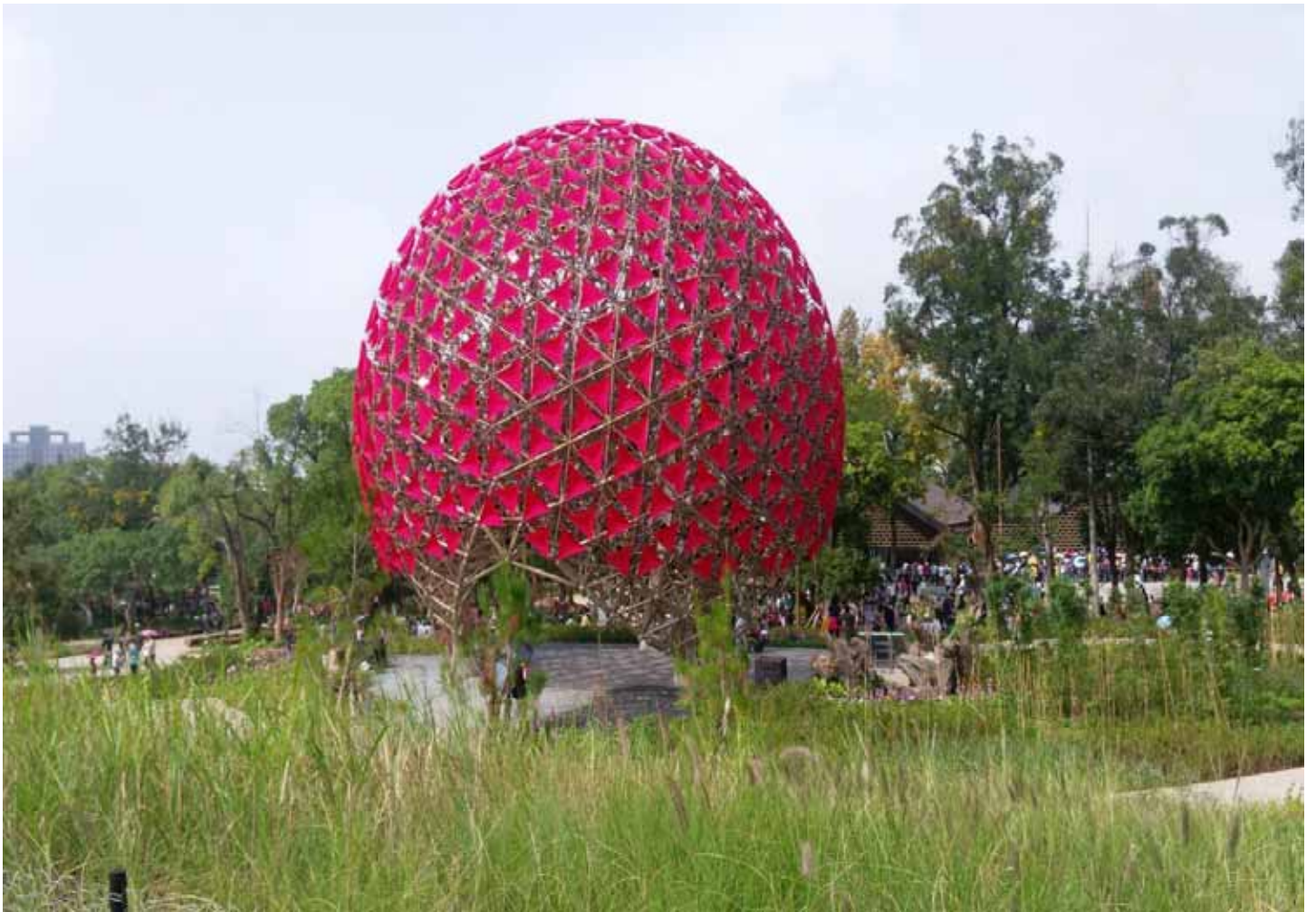
“聽見花開的聲音”~結合藝術、人文、科技，地表最大的機械花