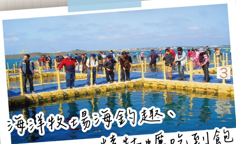
海洋牧場海釣趣、 烤牡蠣吃到飽