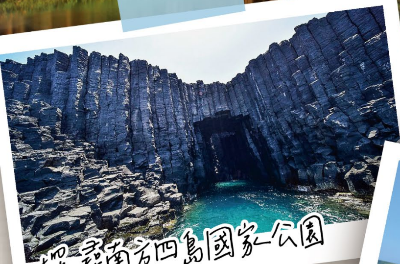
探索南方四島國家公園