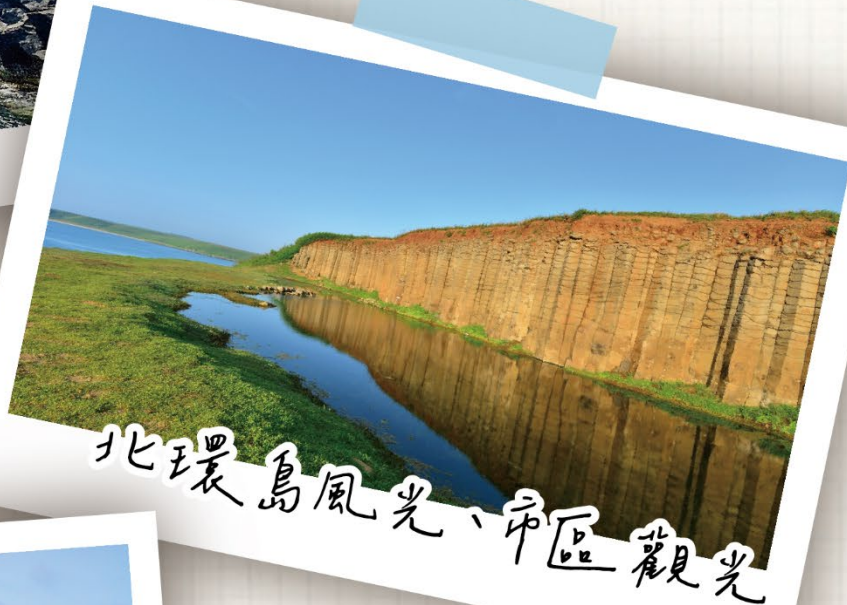
北環島風光、市區觀光